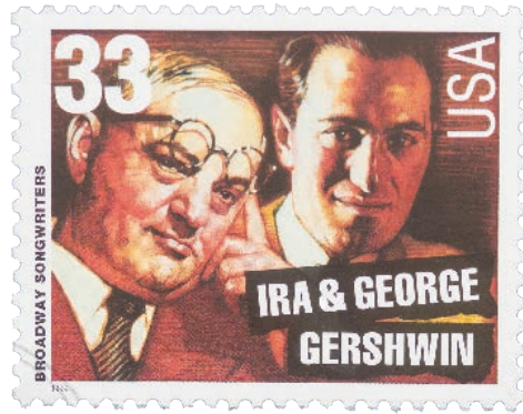
Postzegel uit ca. 1999

Tijdens een treinreis stuit hij op de vorm van het nieuwe stuk. 'De trein – met zijn stalen ritmes [van de rails] zo stimulerend voor een componist. Daar hoorde ik, zag het zelfs op papier helemaal voor me, de hele constructie van begin tot eind... Een soort muzikale caleidoscoop van Amerika, onze immense smeltkroes, ons elan, onze stedelijke waanzin. Tegen de tijd dat ik in Boston was stond de vorm vast.' Is het een probleem dat weliswaar de melodieën hem aanvliegen, maar hij weinig van instrumentatie weet? Whiteman heeft nog wel speciaal zijn band